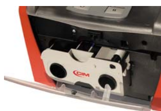
Vano di caricamento nastro a cartuccia

Garanzia di 2 anni sulla macchina e sulla testina di stampa.