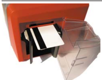
Vano caricamento card di semplice accesso