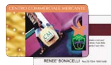
Cassetto raccolta card stampate