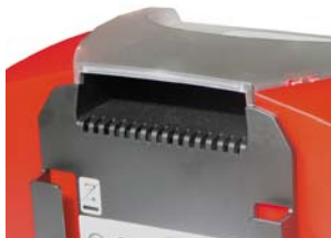
Presca manuale posteriore antiscivolo